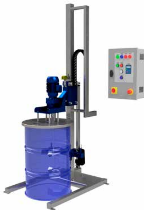
Варелна миксираща установка