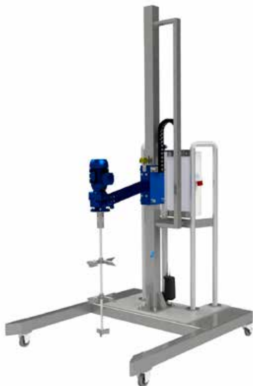
Мобилна миксираща установка